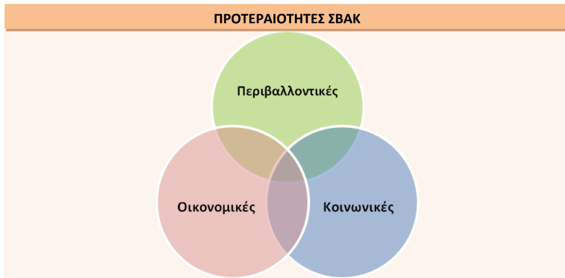
Εικόνα Error! No text of specified style in document.-1: Προτεραιότητες ΣΒΑΚ

Εντός του παραπάνω πλαισίου σχετικά με το ΣΒΑΚ Δήμου Παλαιού Φαλήρου αναπτύσσονται ορισμένες προτεραιότητες (βλέπε Πίνακα παρακάτω) κατηγοριοποιημένες ανάλογα με τη διάσταση της βιωσιμότητας στην οποία αναφέρονται, εμπεριέχοντας τις προαναφερθείσες θεματικές ανά κατηγορία, δηλαδή: